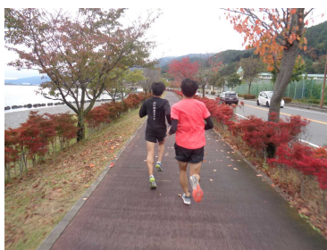
▲講師についていく会員