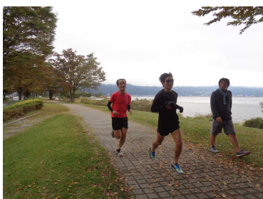
▲10km給水を過ぎペースアップ